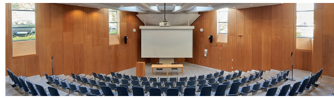
Hörsaal im Krankenhaus Für Naturheilweisen Auf dem Gelände des Klinikums Harlaching Seybothstraße 65 81545 München